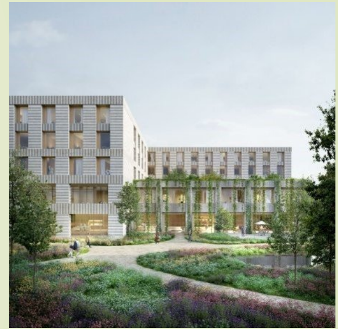
Planung des Neubaus bis 2029